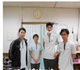
リハビリスタッフ