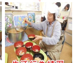
生活行為練習 味噌汁入れ